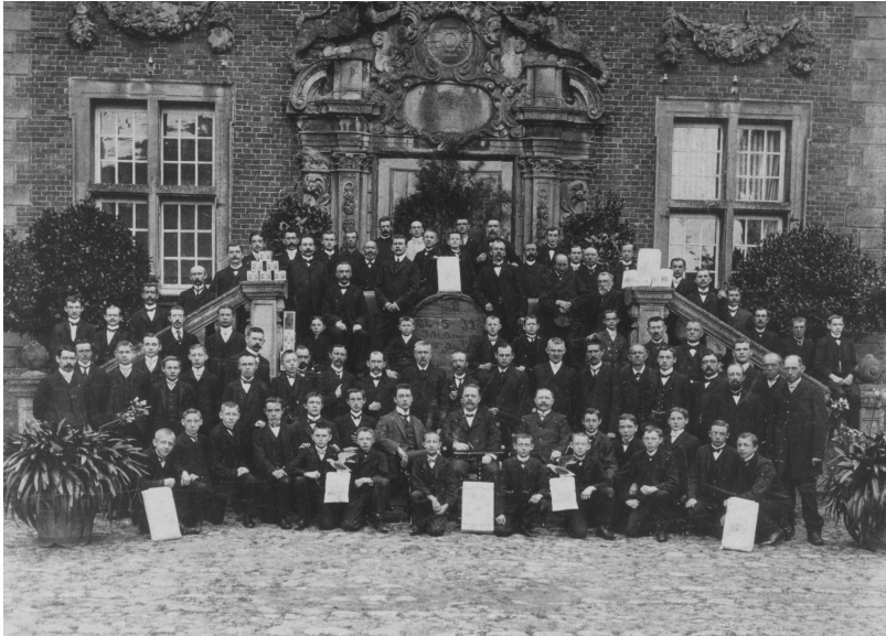
Abbildung 15: Die Belegschaft der Tabakfabrik Oldenkott im Innenhof des Schlosses (1919) 524

Die Übernahme des Schlosses als Wohnsitz, der Erwerb und die Wiederherrichtung des alten Schlossparks dürften dazu beigetragen haben, die soziale Stellung der Oldenkotts zu untermauern: Die fürstliche Familie Salm-Kyrburg verfügte nicht mehr über die Mittel, um das Wasserschloss samt Anlagen halten zu können – die Unternehmerfamilie Oldenkott jedoch schon. 525 Mit Blick auf das im Stadtbild besonders präzente Bauwerk waren die Fabrikanten damit im wahrsten Sinne des Wortes an die Stelle der kirchlichen und weltlichen Fürsten getreten.