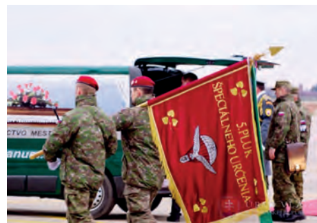
Abb.II.5.7 Ehrung gefallener slowakischer Soldaten aus dem Afghanistan-Einsatz

Die Slowakei trat 2004 der NATO bei, nachdem sie bereits Mitte der 1990er Jahre am PfP-Programm teilnahm. Seit 2011 ist die Slowakei für das NATO Centre of Excellence für EOD, d. h. Kampfmittelbeseitigung, zuständig. 2016 wurde die NATO Force Integration Unit (NFIU) zur Aufnahme von Schnelleingreifkräften (VJTF) der NRF in Bratislava aufgestellt. Die Slowakei hat auch zugesagt, sich mit Kräften an der von Rumänien als Leadnation aufzustellenden Multinationalen Division Südost (MND SE) neben weiteren zehn Nationen zu beteiligen. Die Slowakei wirkt damit an der Umsetzung der in Wales (2014) und Warschau (2016) beschlossenen Bündnisverteidigung im Rahmen des Rapid Action Plans im Rahmen seiner finanziellen Möglichkeiten und militärischen Fähigkeiten mit. Wie andere osteuropäische NATO- bzw. EU-Staaten kann auch die Slowakei ihre Ostgrenze nur im Bündnisrahmen durchhaltefähig und nachhaltig verteidigen.