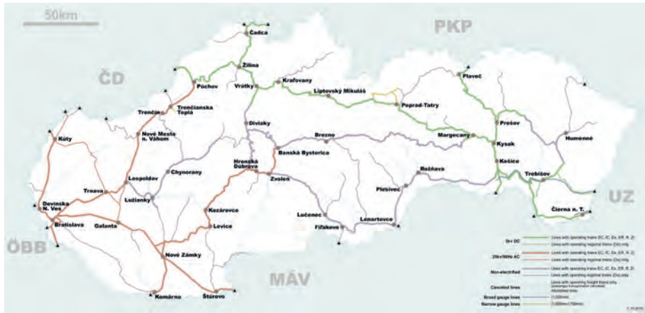
Abb.II.5.2 Schienennetz der Slowakei

umfassende Autobahnnetz. In den kommenden Jahren wird eine durchgehende Autobahn zwischen Bratislava – Žilina – Košice fertig gestellt werden, wobei bereits jetzt eine direkte Autobahnverbindung die Hauptstadt Bratislava mit Prag und Wien verbindet. In Richtung Budapest geht der Autobahnbau weiter voran. Das Schienennetz bedarf einer dringenden Modernisierung. Es ist insgesamt 3600 km lang, wovon nur 50 Prozent elektrifiziert sind. Die Slowakei verfügt über 172 km Wasserstraße auf der Donau und damit einen Zugang zum Schwarzen Meer und ist über den Rhein-Main-Donau-Kanal mit der Nordsee verbunden.