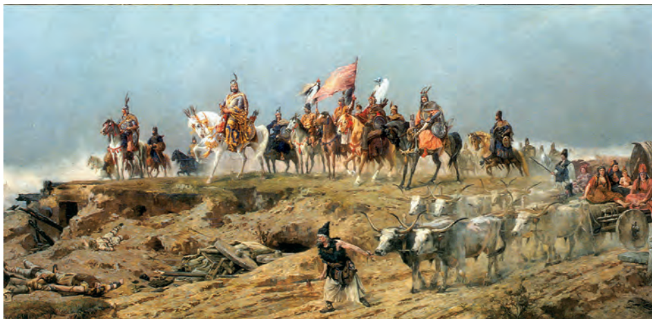
Abb.II.6.5 Madjarische Reitervölker – Vorfahren der Ungarn

Der Erste Weltkrieg und der durch ihn verursachte Zusammenbruch der europäischen Staatenwelt markiert für die Geschichte der heutigen Republik Ungarn eine der wesentlichen Zäsuren. Im Rahmen der dualistisch gegliederten österreichisch-ungarischen k. u. k. Monarchie, welche ein von inneren Spannungen geprägter Vielvölkerstaat war, zog Ungarn am 28. Juli 1914 in den Krieg. (CLARK 2013). Im Verlauf des Krieges, der für Österreich-Ungarn fatal war, wurden die Nationalitätenkonflikte innerhalb der Doppelmonarchie immer deutlicher und spätestens mit dem Kriegseintritt der USA 1917 und der Verkündung des „14-Punkte-Plans“ des amerikanischen Präsidenten Woodrow Wilson am 8. Januar 1918 wurde deutlich, dass nach einer Niederlage der Mittelmächte mit einer Aufteilung der Doppelmonarchie gerechnet werden musste (KRÜGER 2012). In Bezug auf Österreich-Ungarn führte Wilson aus: „Den Völkern Österreich-Ungarns, deren Platz unter den Nationen wir gefestigt und gesichert zu sehen wünschen, sollte die freiste Möglichkeit autonomer Entwicklung gewährt werden...“ (Zitiert nach LAUTEMANN und SCHLENKE 1975). Das Selbstbestimmungsrecht der Völker bedeutete in seiner praktischen Umsetzung das Entstehen einer ganzen Reihe neuer Staaten auf dem Gebiet des früheren Vielvölkerstaates Österreich-Ungarn.