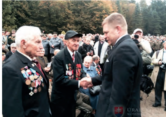
Abb.II.5.6 Ehrung von Veteranen

Oberbefehlshaber der Streitkräfte ist der Staatspräsident. Der Einsatz der Streitkräfte erfolgt auf der Basis von Parlamentsbeschlüssen. Die Streitkräfte bestehen aus Heer und