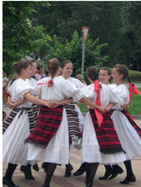
Abb.II.6.8 Ungarischer Volkstanz

Das Durchschnittsalter der ungarischen Bevölkerung liegt bei 41,8 Jahren. Das Bevölkerungswachstum ist mit -0,24 Prozent leicht rückläufig. Die Geburtenrate beträgt 9,1 Lebendgeburten auf 1000 Einwohner. Das bedeutet, dass Ungarn ähnliche Probleme mit der Überalterung der Gesellschaft drohen, wie sie auch in anderen europäischen Staaten bestehen. 85,6 Prozent aller Einwohner Ungarns bezeichnen sich als ethnische Ungarn, 3,2 Prozent als Sinti bzw. Roma und 1,9 Prozent als Deutsche. Weitere 16,7 Prozent sind Slowaken, Polen, Ruthenen, Armenier, Bulgaren, Kroaten, Serben, Slowenen, Ukrainer und Rumänen. Der Ausländeranteil betrug 2015 ca. 1,5 Prozent der Gesamtbevölkerung. In Bezug auf die Konfessionszugehörigkeit sind 37,2 Prozent der Ungarn römisch-katholisch, 11,6 Prozent Calvinisten, 2,2 Prozent Lutheraner, 1,8 Prozent griechisch-katholisch, 18,2 Prozent konfessionslos und 27,2 Prozent machten keine Angabe (Volkszählung 2011). Die ethnischen Gruppen sind weitgehend in die Gesellschaft integriert. In Ungarn gibt es keine sicherheitspolitisch relevanten ethnischen Konflikte.