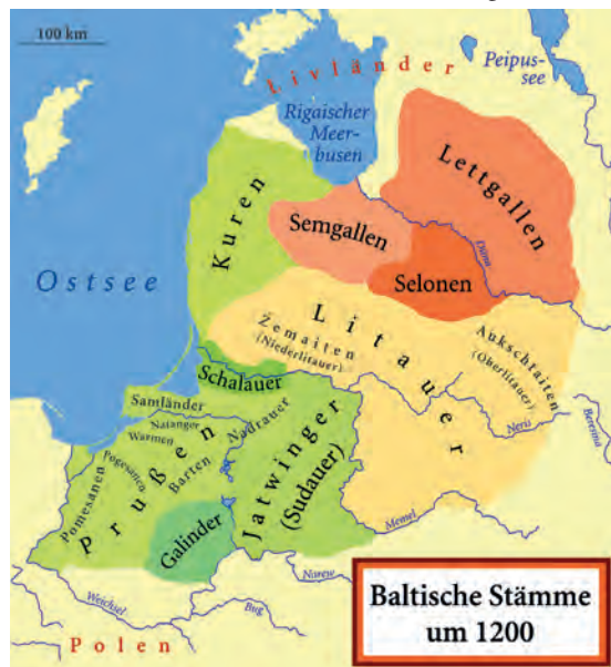
Abb.II.2.2 Baltische Stämme um 1200

Riga wurde 1282 deutsche Hansestadt. Bis heute prägt der deutsche Einfluss die markante Altstadt. Mit der vernichtenden Niederlage des Deutschen Ordens bei Tannenberg fielen Teile Lettlands 1410 an das römisch-