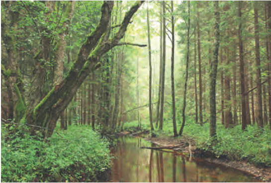
Abb.II.1.2 Dichtes, dschungelartiges Waldgebiet im südöstlichen Estland

ger für Ackerwirtschaft geeignet erscheinen, dennoch macht dieser Teil der landwirtschaftlichen Nutzfläche aus Gründen traditioneller Eigen- und Selbstversorgung etwa zwei Drittel aus.