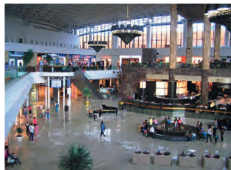
Abb.II.7.6 Iaşi (Moldau) – Erlebniseinkauf in der Palasmall bei Live-Musik

Die wirtschaftliche Transformation ist aber noch nicht abgeschlossen. Frei gesetzten Arbeitskräften mit geringer Qualifikation bleibt oft nur der Weg in die Arbeitslosigkeit, wenn sie nicht z. B. in der Subsistenzlandwirtschaft einen Unterschlupf finden. Ein anderer Ausweg ist die Arbeitsmigration, bevorzugt in romanischsprachige Länder, besonders nach Italien, Spanien oder Portugal. Mit ihren Remissen sorgen die Migranten einerseits dafür, dass der Rest der Familie in der Heimat überleben kann, andererseits investieren sie die Ersparnisse in Hausbauten oder örtliche