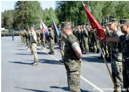
Abb.II.5.8 Abschlussappell einer NATO-Übung in der Slowakei

Wie in Ungarn und in Polen, ist auch in der Slowakei nicht davon auszugehen, dass sich der eingeschlagene EU-skeptische Kurs und die nationalkonservativen politischen Tendenzen in den kommenden Jahren ändern werden. Die jetzige Regierung in der Slowakei ist im Jahr 2016 bestätigt worden und das Parlament um eine noch radikalere nationalistische Partei ergänzt worden. Die EU-Ratspräsidentschaft vom 1. Juli 2016 bis zum 31. Dezember 2016 – die erste seit dem Beitritt der Slowakei 2004 – hat die Slowakei technisch gut gemeistert, jedoch änderte dies nichts am Verhältnis des Durchschnitts-Slowaken zur EU. Diese sei weit Weg und die Bürokraten dort haben mit dem Alltag der Menschen nichts zu tun (KIRCHGESSNER 2016).