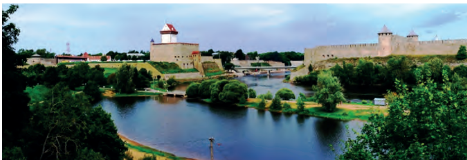
Abb.II.1.9 Estnisch-russischer Grenzfluss Narva

Estnische Politiker im Besonderen und baltische Akteure im Allgemeinen hatten es dabei in den letzten Jahren schwer, den Westen von der unmittelbaren Bedrohung durch Russland zu überzeugen und entsprechenden Beistand zu organisieren. Sie bekommen aber seit Mitte 2015 zunehmend breite westliche Unterstützung (DER SPIEGEL 2016, METZ 2016) durch breitangelegte gemeinsame NATO-Manöver im baltisch-polnischen Raum.