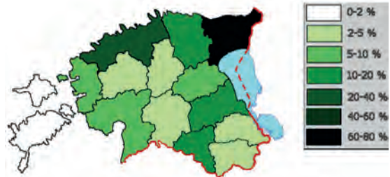
Abb.II.1.7 Verteilung der russischen Bevölkerung

Zusammenfassend belegt die oben dargestellte Differenzierung zwischen „Altrussen“ und „Neurussen“ in Estland, dass es gerechtfertigt erscheint, nicht nur verallgemeinernd von „der russischen Minderheit“ in Estland, sondern vielmehr differenzierend von „den russischen Minderheiten“ in Estland zu sprechen (FELDMANN 2003, KIRCH 1992, MAEDER-MECALF 1997). Darüber hinaus