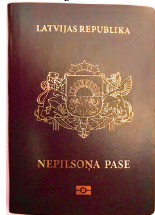
Abb.II.2.7 Lettischer Nichtbürger-Pass

Die Schaffung des Sonderstatus ist als späte Reaktion auf die erzwungene Russifizierung während der Sowjetunion zu erklären. Mit der Resolution „Zur Wiederherstellung der staatsbürgerlichen Rechte lettischer Bürger und die Grundprinzipien der Naturalisierung“ wurde durch den Obersten Sowjet Lettlands am 15. Oktober 1991 die Staatsbürgerschaft nur denjenigen Bürgern und ihren Nachkommen gewährt, die diese bereits vor 1940 inne hatten. 700.000 meist russischstämmige Einwohner, die während der Sowjetunion in Umsiedlungsprojekten nach Lettland gelangt waren, erhielten damit die lettische Staatsbürgerschaft nicht. Gleichzeitig waren sie keine Staatsbürger ihres Ursprungslandes. (KARKLINS, 1998)